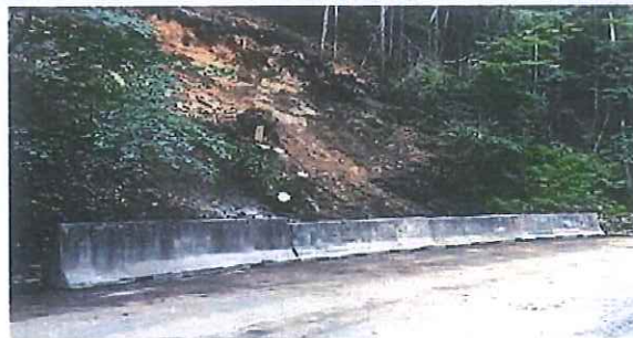
Betonová svodidla New Jersey viz. foto.